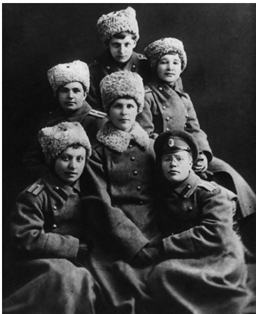
Девушки-прапорщики ускоренного выпуска Александровского военного училища

Проходящая рота засмеялась, но коротким смехом, будто поняв особенность и серьезность услышанного приказа. У моста становилась на позицию, чтобы прикрыть отход армии, маленькая женская боевая часть, силою всего в 15–20 человек с пулеметом. Ее состав — ударницы женских батальонов; иные в чине прапорщика, иные с георгиевскими крестами.