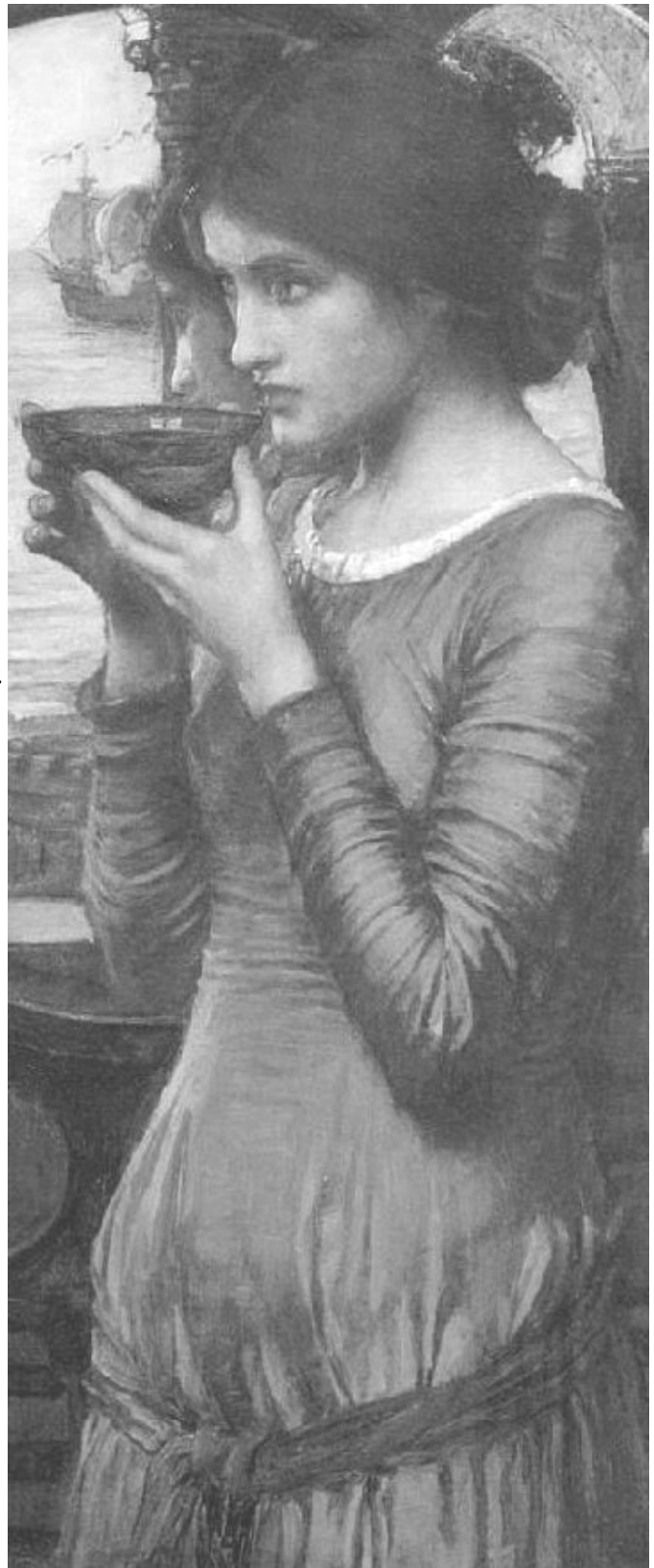
Дж. Уотерхауз «Судьба». 1902