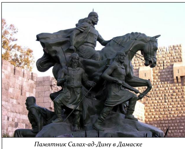
Памятник Салах-ад-Дину в Дамаске

Исламская цивилизация, возникшая благодаря арабским завоеваниям, страдала от ожесточенной вражды между шиитами и суннитами, а в X-XII вв. сдавала свои позиции под натиском крестоносцев и Византии. Утверждение в прибрежной полосе Сирии франкских государств и захват Сицилии норманнами (1071 г.) лишили Фатимидский (шиитский с центром в Каире) халифат господства на Средиземном море и постепенно привели к переходу средиземноморской торговли в руки итальянских городов. Мятежи половецких, армянских и африканских гвардейцев ослабили военную мощь Фатимидов и стали причиной потери Алжира и Туниса, а турки-сельджуки захватили Сирию и Палестину. Наконец, в 1171 году взятый Фатимидами на военную службу Салах Ад-