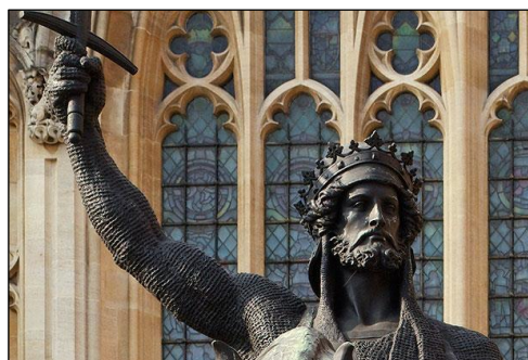
Памятник Ричарду I Львиное Сердце в Лондоне (1851 г.)

Ситуация радикально изменилась с приходом венценосных крестоносцев и их армий – теперь явный перевес был на стороне христиан. Для рядовых участников осады Ричард Львиное Сердце стал, без сомнения, вождем. Он был славным рыцарем, известным всей Европе, всюду успевал, всех подбадривал, был беспощаден к трусам и мародерам. Штурм продолжался несколько дней. Ричард находился в передних рядах – он был словно заколдован: ни одна стрела не могла его поразить. Каждый день отряды мусульман нападали на лагерь крестоносцев, но так и не смогли прорваться в город.