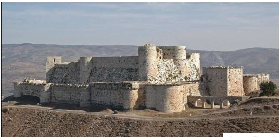
Крепость Крак де Шевалье

Падение Иерусалимского королевства. Вскоре сарацины завладели почти всеми прибрежными городами к югу от Триполи – Иерусалим был отрезан от сообщения с Европой. Когда мусульмане подошли к Священному городу, его защитники оказали героическое сопротивление и продержались 12 дней. Но 2 октября, после очередного пролома стен, им стало ясно, что конец близок – начались переговоры. Саладин поступил мудро и не стал чинить грабежей и массовых убийств, как крестоносцы 80 лет назад. Христианам было дозволено уйти, заплатив выкуп 32 . Дома тамплиеров отмывали и орошали розовой водой, мечеть аль-Акса была освящена заново, а Крест Господень пронесли по всему городу и били его дрекольем 33 . За крестоносцами остались лишь Тир, Триполи, спасенный норманскими пиратами, Антиохия и мощная крепость госпитальеров (иоаннитов) Крак де Шевалье.